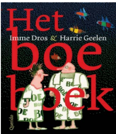
Kaft van Het boe boek

Het voelt misschien als vreemdgaan na zo'n langdurige, intensieve en succesvolle samenwerking met Joke van Leeuwen. Maar onze nieuwe eerste familievoorstelling in de komende planperiode maken we met niemand minder dan Zilveren Griffel-winnaar Imme Dros en de in Heerlen geboren en opgegroeide animator, dichter, schrijver en stem-acteur Harrie Geelen. Zij maakten samen het 'Het boe boek'. Vanuit Querido hebben we een principeakkoord van zowel de schrijver als de tekenaar om van hun boek een theaterbewerking te maken.