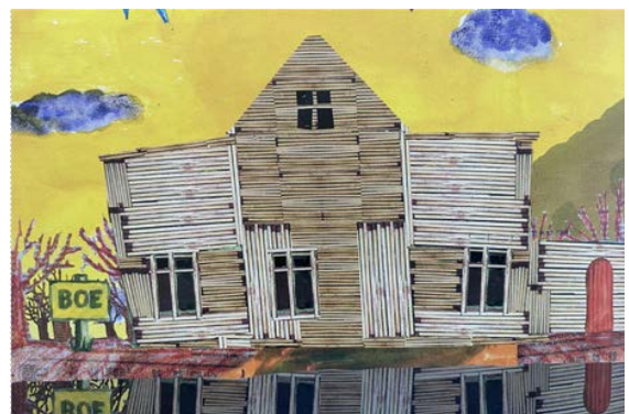
Illustratie uit Het boe boek van Harrie Geelen