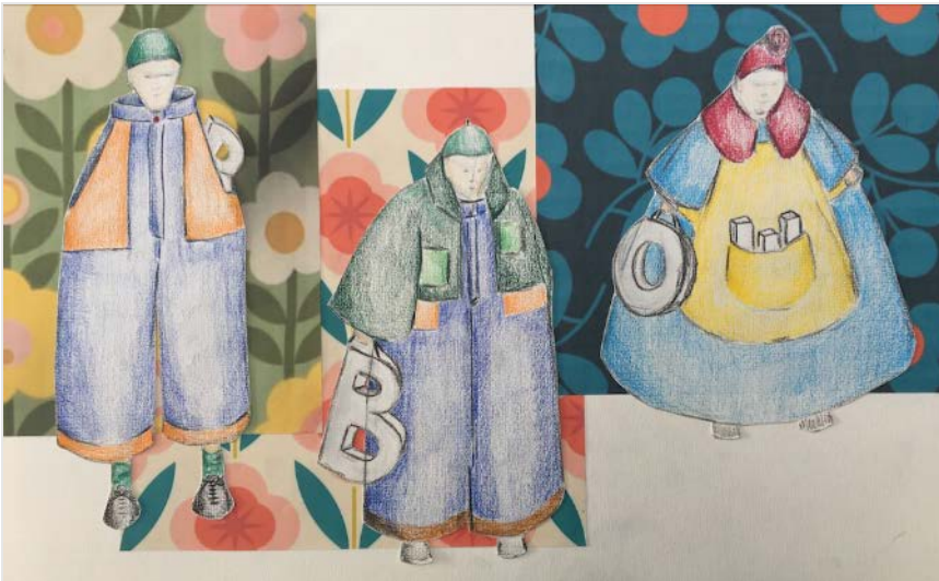
Kostuumschetsen 'Boe' - Sanne Puyk

We verwachten 'Boe' tijdens deze tournees, inclusief de reisetournee 70 keer te spelen. Zowel in 2027 als in 2028 is 'Boe' tijdens de Kinderboekenweek in de theaters te zien.