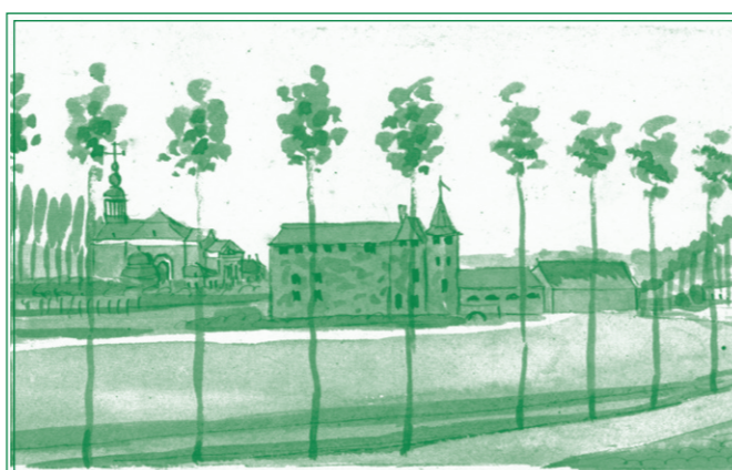
L'emptoriste et ancien Château des Seigneurs

→ Blijf het pad volgen dat parallel loopt aan de Witteimer Allee 5 . Je komt langs een huis. Een paar honderd meter na het huis loop je over een kleine dijk.